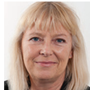
Bi Puranen, general- sekreterare, World Values Survey