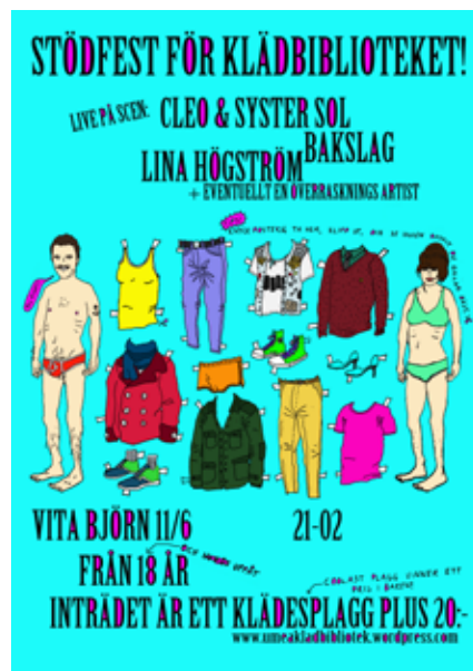
ILLUSTRATION: ROBIN ALVAR

Affisch till stödfest för Umeå klädbibliotek som startade i juli 2010. Mot en liten årlig avgift kan låntagaren här låna kläder gratis.