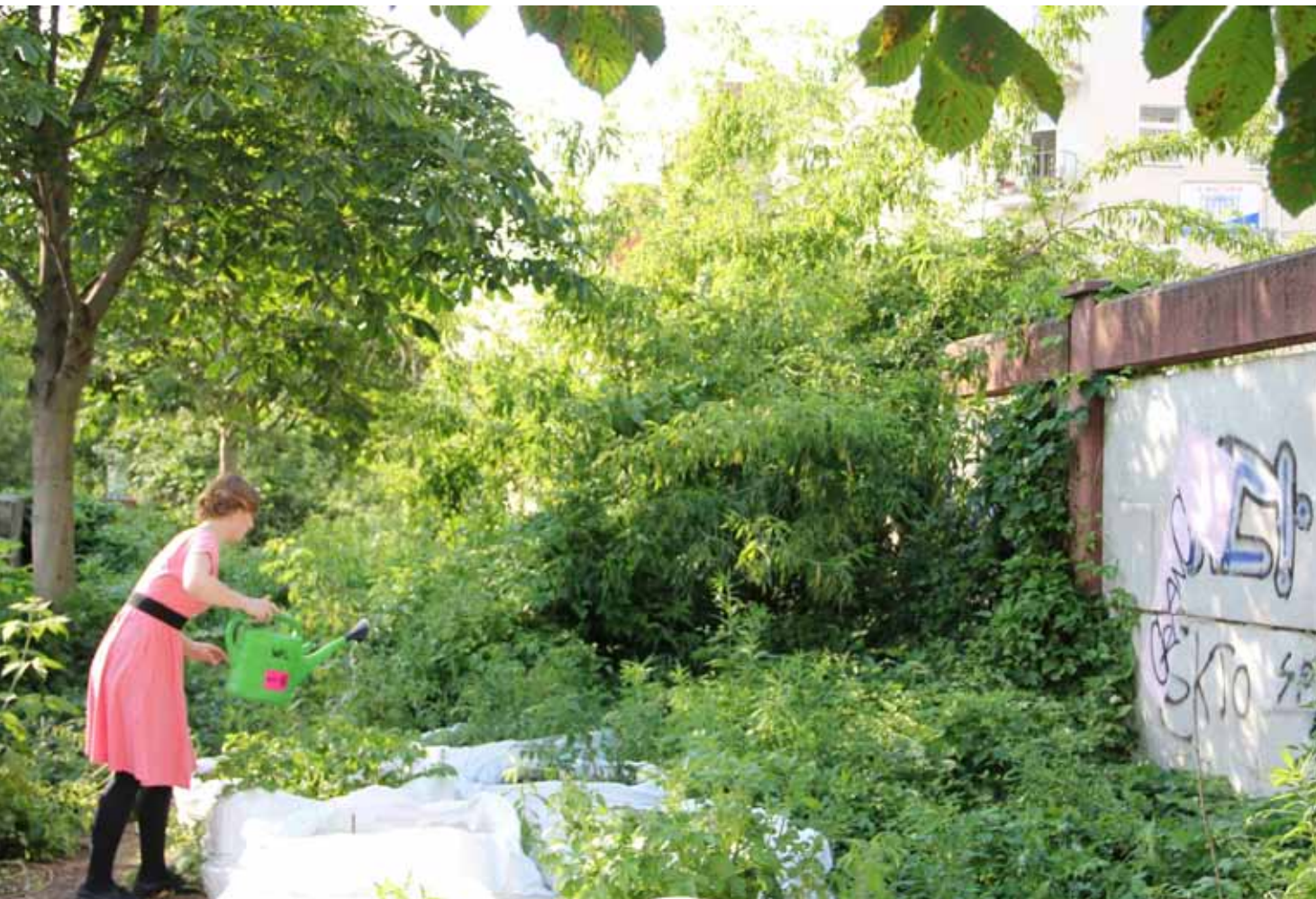
Odling i stadsmiljö, Berlin.

relativt små justeringar av dagens livsstilar: mindre dagligt bilåkande, lite bättre miljötekniska lösningar, lite mer sopsortering och ekologiska produkter. I övrigt blir det mesta sig likt: samma tillväxtekonomi, samma eller snarare ökat resande, samma eller ökande konsumtionsnivå, samma globala arbetsdelning med etanolbilar i Nord och förlorad jordbruksmark i Syd, samma storskaliga infrastruktur, samma typ av matproduktion och samma västcentrerade urbana medelklassnormer om ett gott liv.