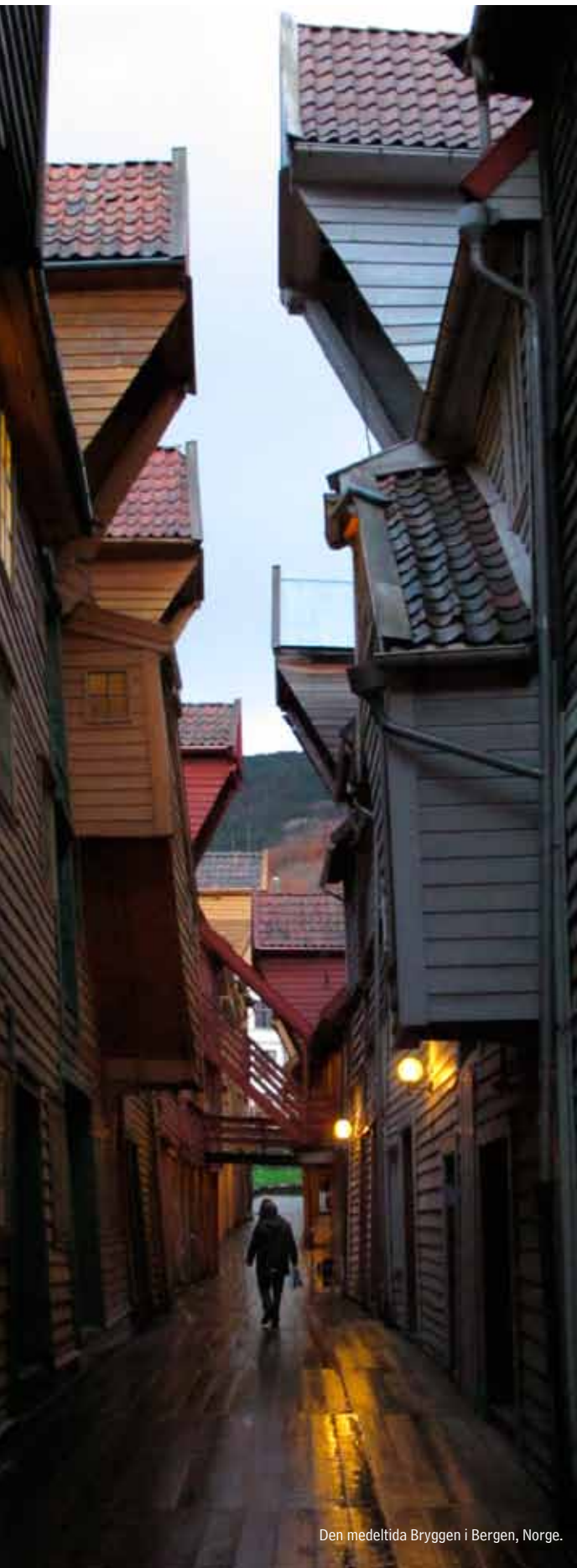
Den medeltida Bryggen i Bergen, Norge.