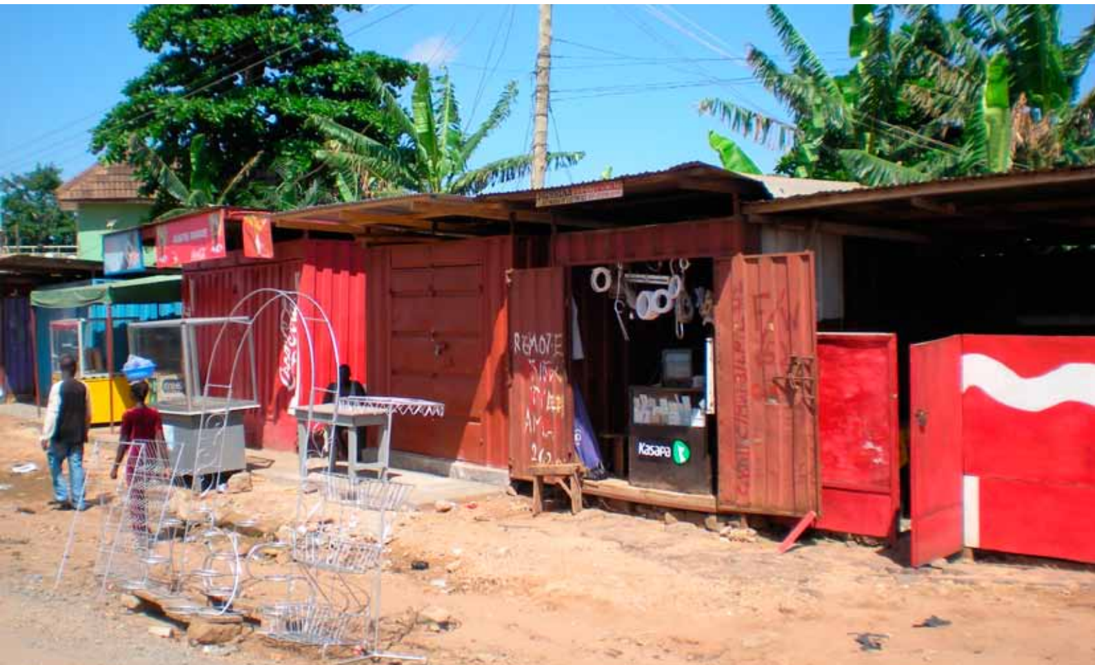
Containrar som butiker, Accra, Ghana.

handelssystemet – med sina isolerade frihamnar, sin transnationella arbetsstyrka och sin globalt utspridda varvsnäring. I hans arbeten får det globala rummet tyngd, färg, form, mått och konktion. Det är inte längre ett gränslöst flöde av abstrakta värdetransaktioner, utan en konkret värld av å ena sidan havens enorma utsträckning och å andra sidan det ständiga lastandet och lossandet av containerburet gods.