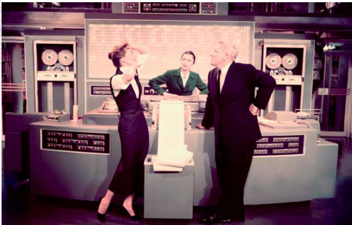
Katharine Hepburn och Spencer Tracy i filmen "Desk set", 1957.

M ellan 50 och 80 procent av västvärldens arbetande befolkning arbetar på kontor. De kontorsanställdas fysiska och sociala arbetsmiljö borde därför vara ett högprioriterat ämne. Ett nytt forskningsprojekt tar nu ett helhetsgrepp som även inkluderar kontorets arkitektur och teknikens roll på arbetsplatsen ur ett hälsoperspektiv.