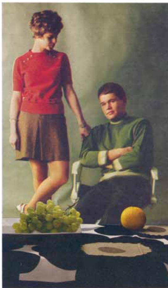
ILLUSTRATION: JAN STEINMARK

Han vill inte prata om hur de har det. Han vill iaktta frukt.