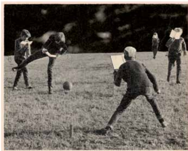
ILLUSTRATION: JAN STENMARK

Redan på den tiden misstänkte vi att existensen enbart är ett språkligt fenomen.